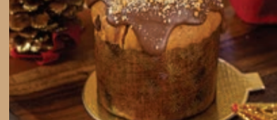
MINI CHOCOTONE PALHA ITALIANA