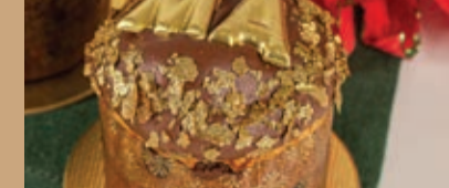
MINI CHOCOTONE NOCCIOLA CROC.